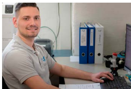
Kuitim Idrizi Lager