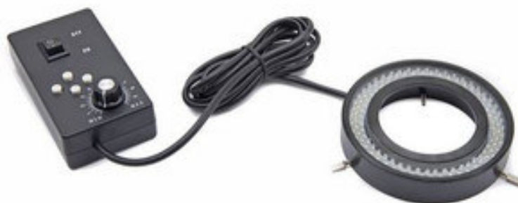
Basic Led Ring CL 16.1 (China)