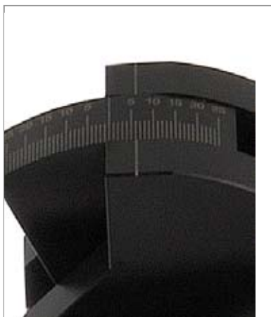
A: Gradeinstellung +/-25° / division en degrés +/-25°