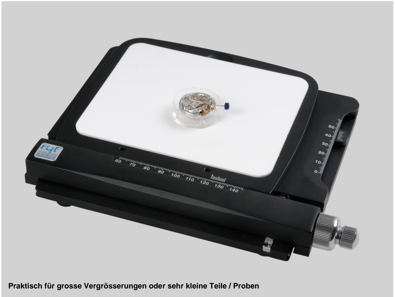
Praktisch für grosse Vergrösserungen oder sehr kleine Teile / Proben