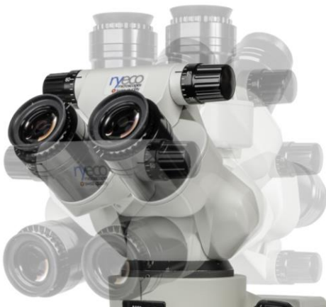
Version Ryeco P-RERGO Super-Ergo Bino- Tilting Binokopf, 0°-180° réglable