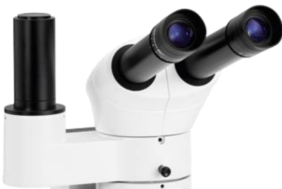
Ryeco Fototubus DSK800