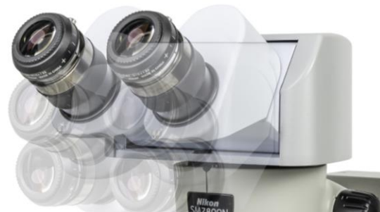
Version Ryeco P-RERG Ergo Bino- Tilting Binokopf, 10°-50° réglable