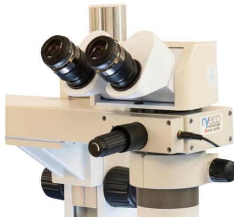
Version Ryeco DSK800 Ergo