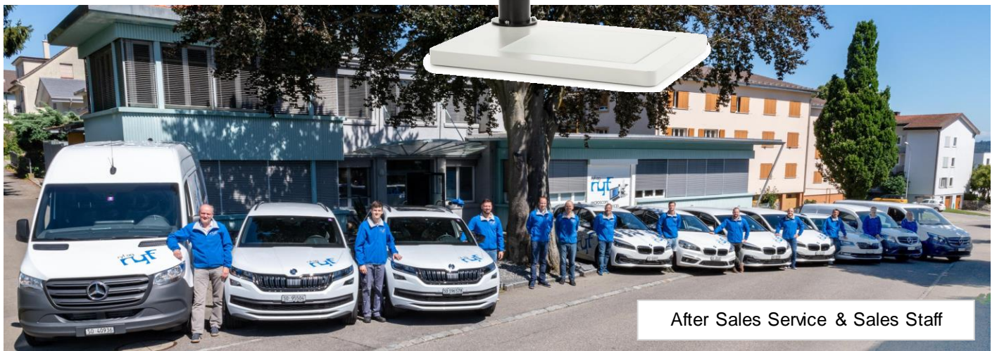
After Sales Service & Sales Staff