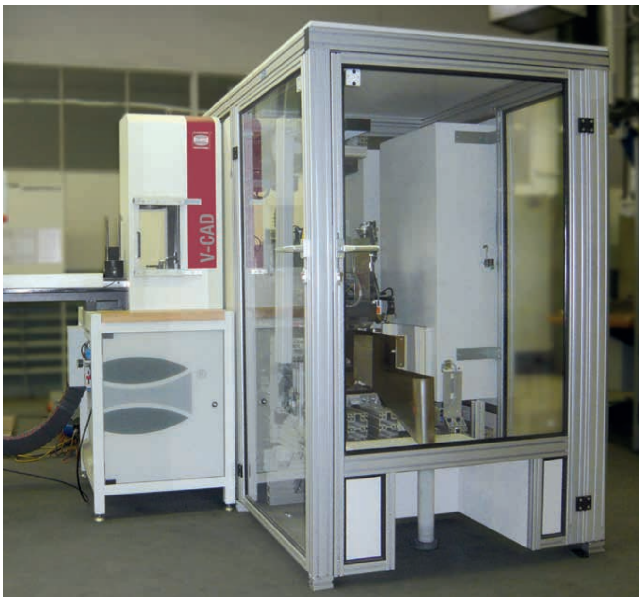
Cellule de mesure avec deux modules V-CAD et une unité d'emballage

final. Il est ainsi possible d'intégrer des systèmes individuels d'alimentation et de sortie de pièces afin de relier entre elles plusieurs stations de mesure. La manutention peut ainsi aller jusqu'au tri et à l'emballage personnalisés pour le client. Parlez-nous de votre projet. Nous trouverons ensemble la configuration optimale pour vos mesures spécifiques !