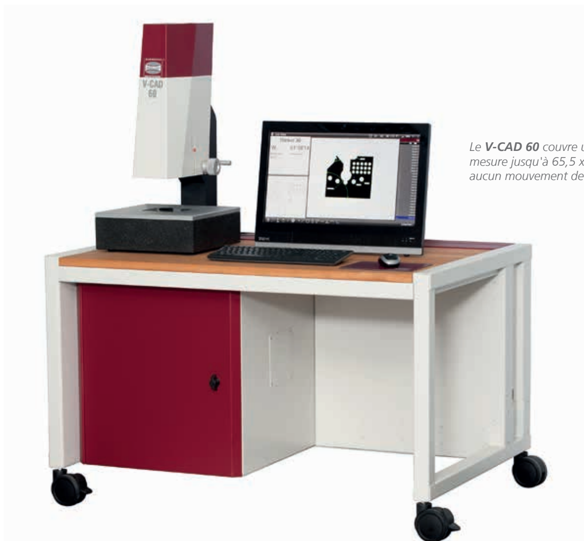
Le V-CAD 60 couvre une étendue de mesure jusqu'à 65,5 x 55 mm, sans aucun mouvement de la table.

seul domaine où vous pouvez personnaliser le produit. Selon les exigences de votre environnement, vous pouvez choisir entre les progiciels de mesure performants M3, SAPHIR et le logiciel primé SAPHIR QD. La série V-CAD est issue de notre expérience de plusieurs décennies dans la construction de machines de mesure multi-capteurs de haute précision. Vous pouvez nous faire confiance – Made by Schneider Messtechnik – Made in Germany – SIMPLY PRECISE !