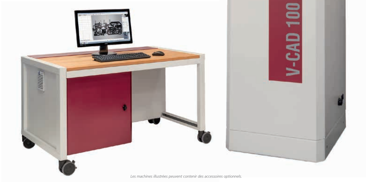
Les machines illustrées peuvent contenir des accessoires optionnels.