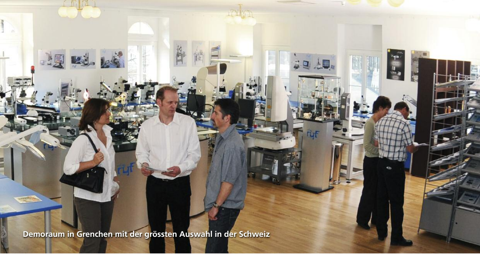
Demoraum in Grenchen mit der grössten Auswahl in der Schweiz